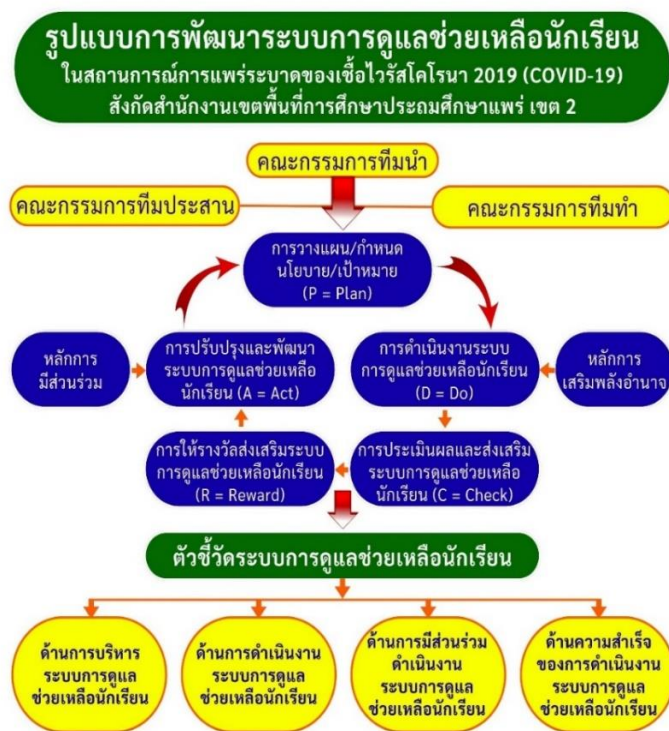
รูปที่ 2 ระบบการดูแลช่วยเหลือนักเรียนในสถานการณ์การแพร่ระบาดของเชื้อไวรัสโคโรนา 2019 (COVID-19) ของสำนักงานเขตพื้นที่การศึกษาประถมศึกษาแพร่ เขต 2

2.1 ระบบการดูแลช่วยเหลือนักเรียนในสถานการณ์การแพร่ระบาดของเชื้อไวรัสโคโรนา 2019 ของสำนักงานเขตพื้นที่การศึกษาประถมศึกษาแพร่ เขต 2 ที่สร้างขึ้น ประกอบด้วย 4 องค์ประกอบหลัก ได้แก่ 1) หลักการ ประกอบด้วย 1.1) หลักการมีส่วนร่วม และ 1.2) หลักการเสริมพลังอำนาจ 2) คณะกรรมการและ บทบาทหน้าที่ ประกอบด้วย 2.1) คณะกรรมการที่ปรึกษา 2.2) คณะกรรมการทีมประสาน และ 2.3) คณะกรรมการ ทีมทำ 3) กระบวนการบริหาร ประกอบด้วย 3.1) การวางแผน/กำหนดนโยบาย เป้าหมายระบบการดูแล ช่วยเหลือนักเรียน 3.2) การดำเนินงานระบบการดูแลช่วยเหลือนักเรียน 3.3) การประเมินผลระบบการดูแล ช่วยเหลือนักเรียน 3.4) การให้รางวัลการส่งเสริมระบบการดูแลช่วยเหลือนักเรียน และ 3.5) การปรับปรุงและ พัฒนาการส่งเสริมระบบการดูแลช่วยเหลือนักเรียน 4) ตัวชี้วัดความสำเร็จการส่งเสริมระบบการดูแลช่วยเหลือ นักเรียน ประกอบด้วย 4.1) ด้านการบริหารระบบการดูแลช่วยเหลือนักเรียน 4.2) ด้านดำเนินงานระบบการ ดูแลช่วยเหลือนักเรียน 4.3) ด้านการมีส่วนร่วมดำเนินงานระบบการดูแลช่วยเหลือนักเรียน และ 4.4) ด้าน ความสำเร็จของการดำเนินงานระบบการดูแลช่วยเหลือนักเรียน